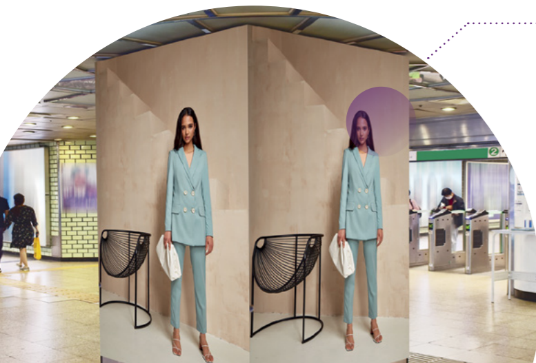
Coluna de LED

LEDs com formatos exclusivos e instalação e implantação convenientes exibem publicidade leve de modo rápido e fácil